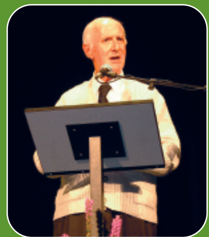
Argizaiola saria 2006